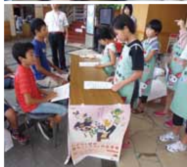
献血模擬体験を楽しむ子どもたち