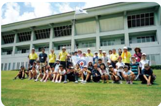
霧島市での参加者