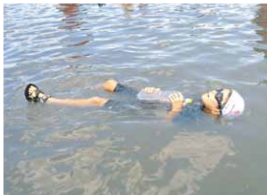
ペットボトルが浮き具に変身

参加者からは、「子どもが自分の身を守る方法だけでなく、親が子どもを安全に助ける方法も学べてよかった」、「親子で触れ合ういい機会になった。」との感想をいただきました。