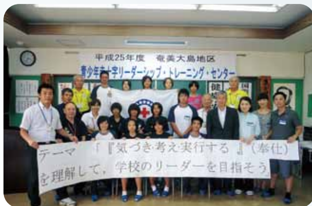
奄美大島での参加者

7月～8月の夏休み期間を利用して、県内の小・中・高校生を対象に青少年赤十字「リーダーシップ・トレーニングセンター（トレセン）」を開催しました。