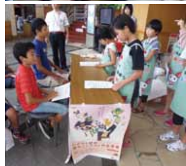
献血模擬体験を楽しむ子どもたち