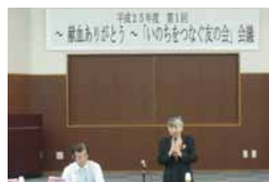
血液センター所長あいさつ